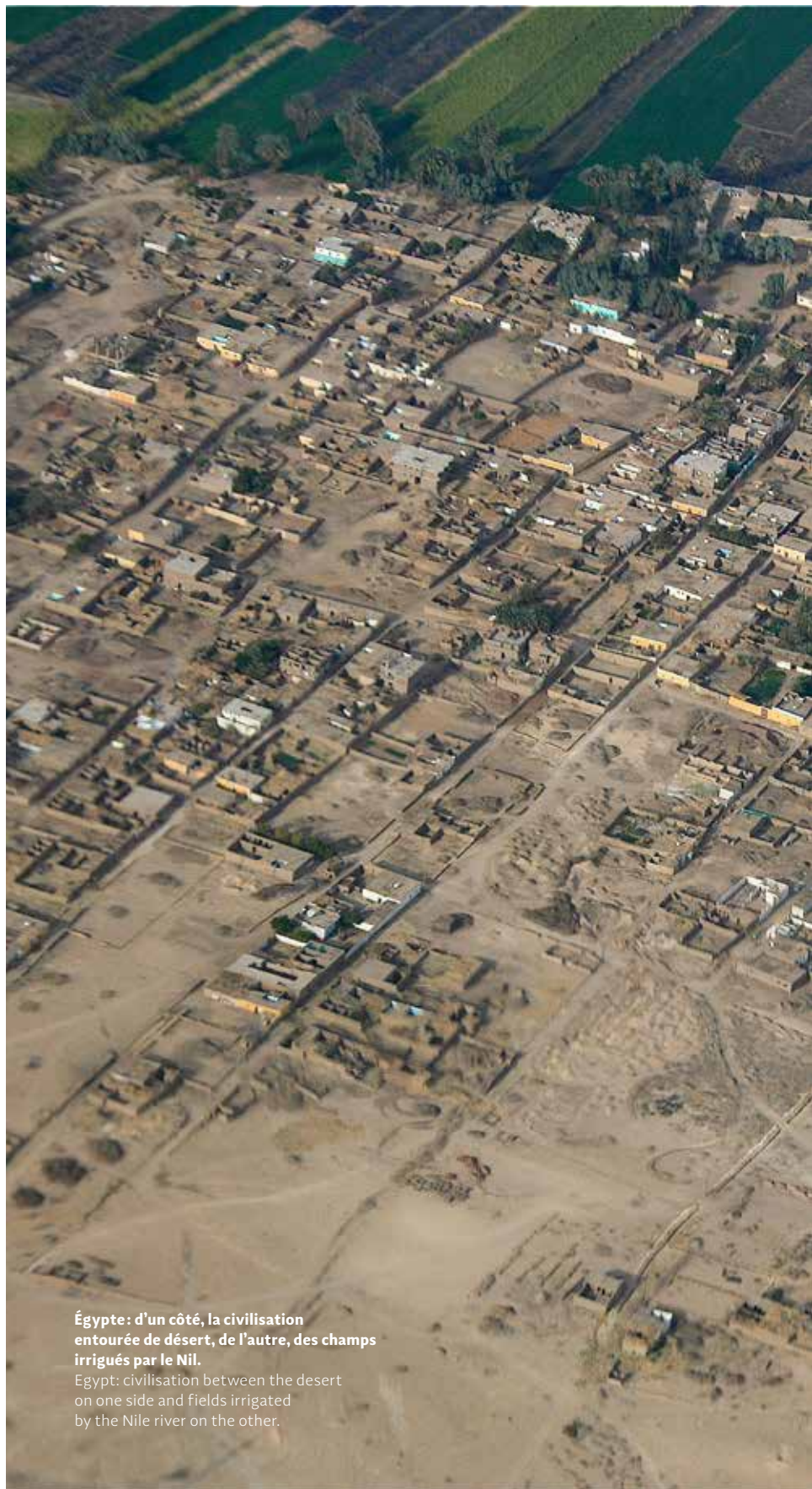
Égypte: d'un côté, la civilisation entourée de désert, de l'autre, des champs irrigués par le Nil.

When it comes to flying in different seasons, the pros and cons of piloting a plane and being a photographer are not always in sync. "All seasons have their pros and cons. For the cons, you have the thunderstorms in summer, the snow in winter, or the fog in autumn. But these can turn into pros regarding photography. The amazing colours that paint the cumulonimbus clouds during sunset, the beauty of a snow-covered →