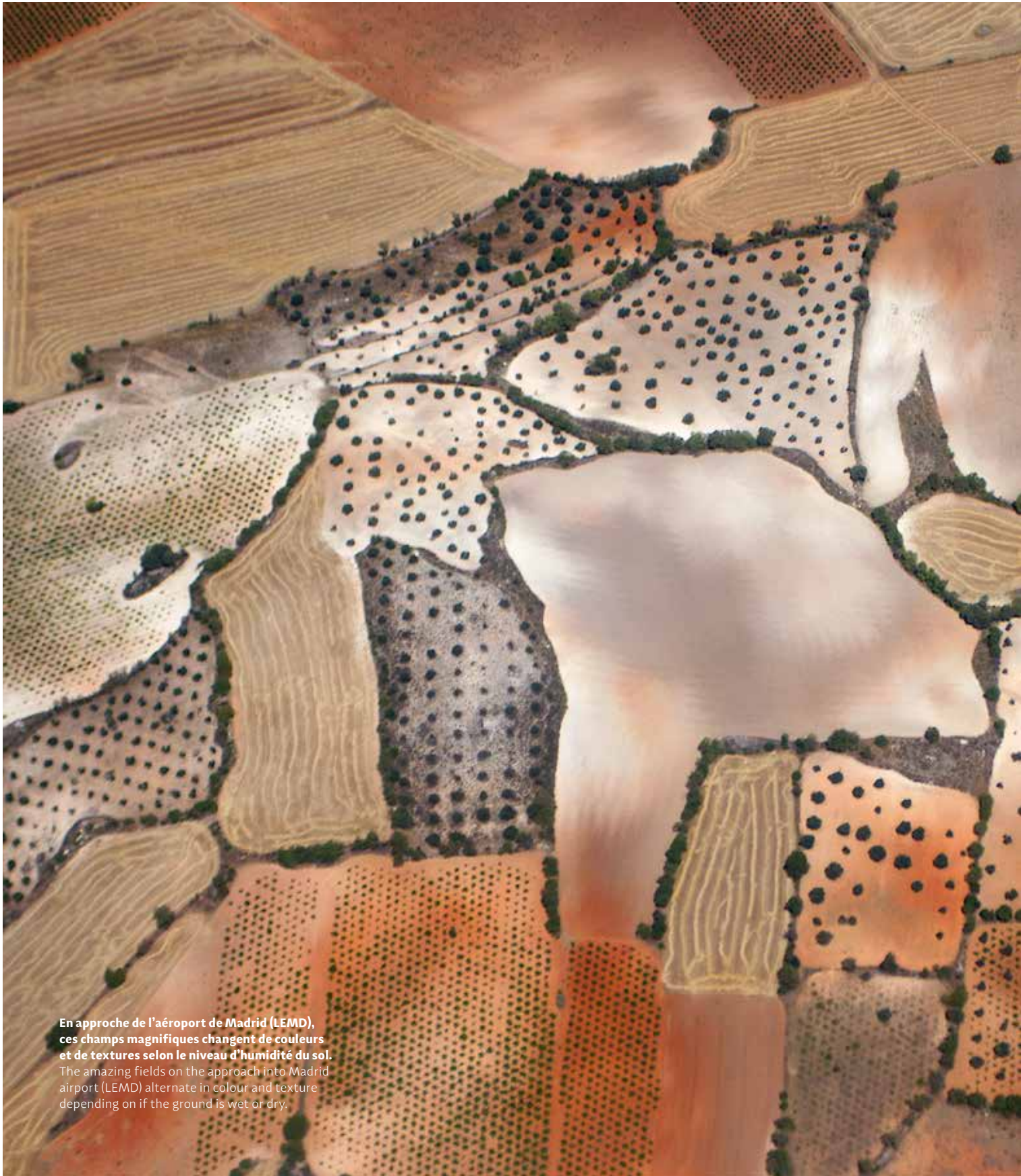
En approche de l'aéroport de Madrid (LEMD), ces champs magnifiques changent de couleurs et de textures selon le niveau d'humidité du sol. The amazing fields on the approach into Madrid airport (LEMD) alternate in colour and texture depending on if the ground is wet or dry.